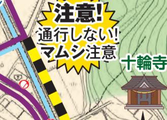
豊橋市指定有形文化財「長孫神社の鯀口」