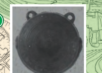
豊橋市指定有形文化財「長孫神社の鯀口」