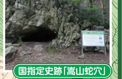
国指定史跡「高山蛇穴」